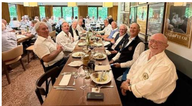
Le repas final s'est bien passé