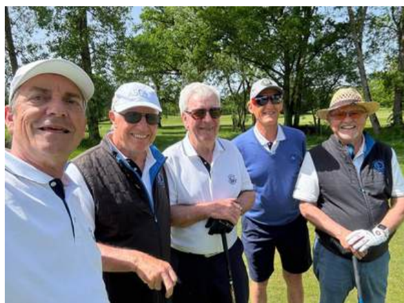
La 3e équipe au départ