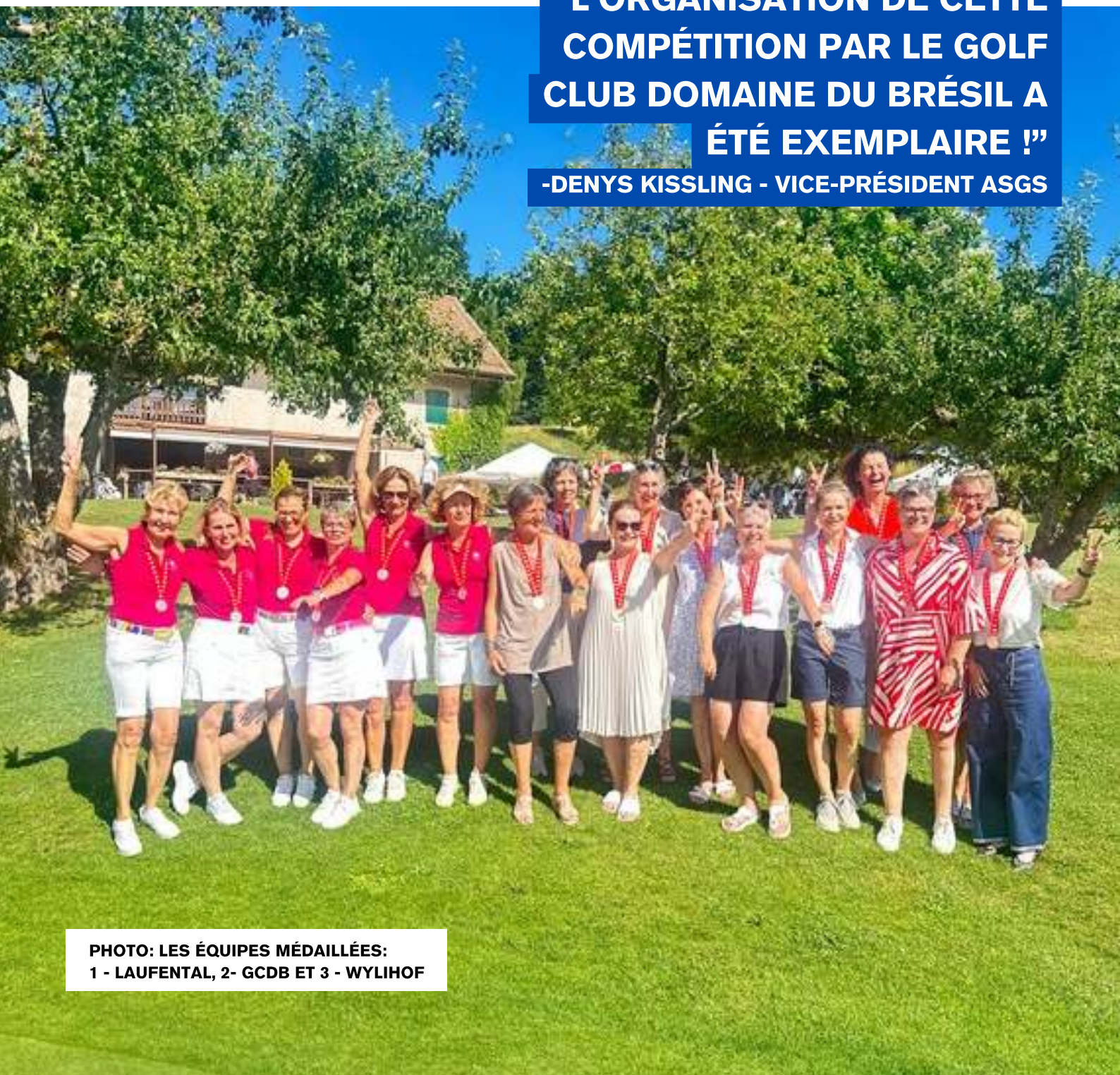
PHOTO: LES ÉQUIPES MÉDAILLÉES: 1 - LAUFENTAL, 2- GCDB ET 3 - WYLIHOF